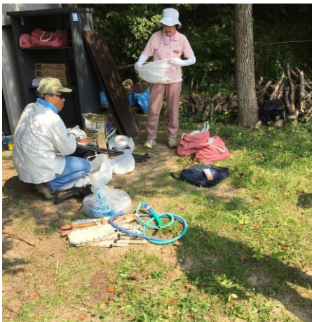
倉庫の整理整頓ならびに機材の台帳確認。次回も継続必要。