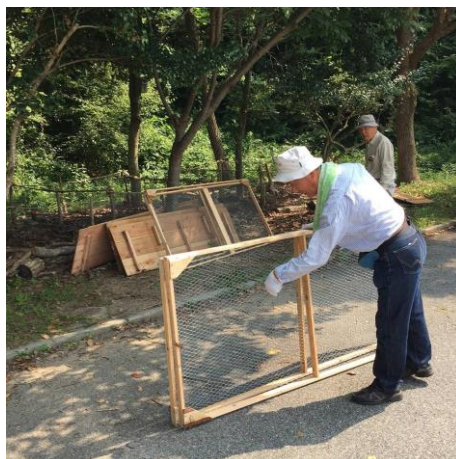
下部の産卵・生育場所の防護木枠を、腐食防止のため一時撤去。この夏産卵孵化した幼虫が3齢幼虫に育つ11月頃に再設置とする。